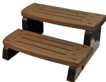
AJL-851-0284 (cor wallnut)