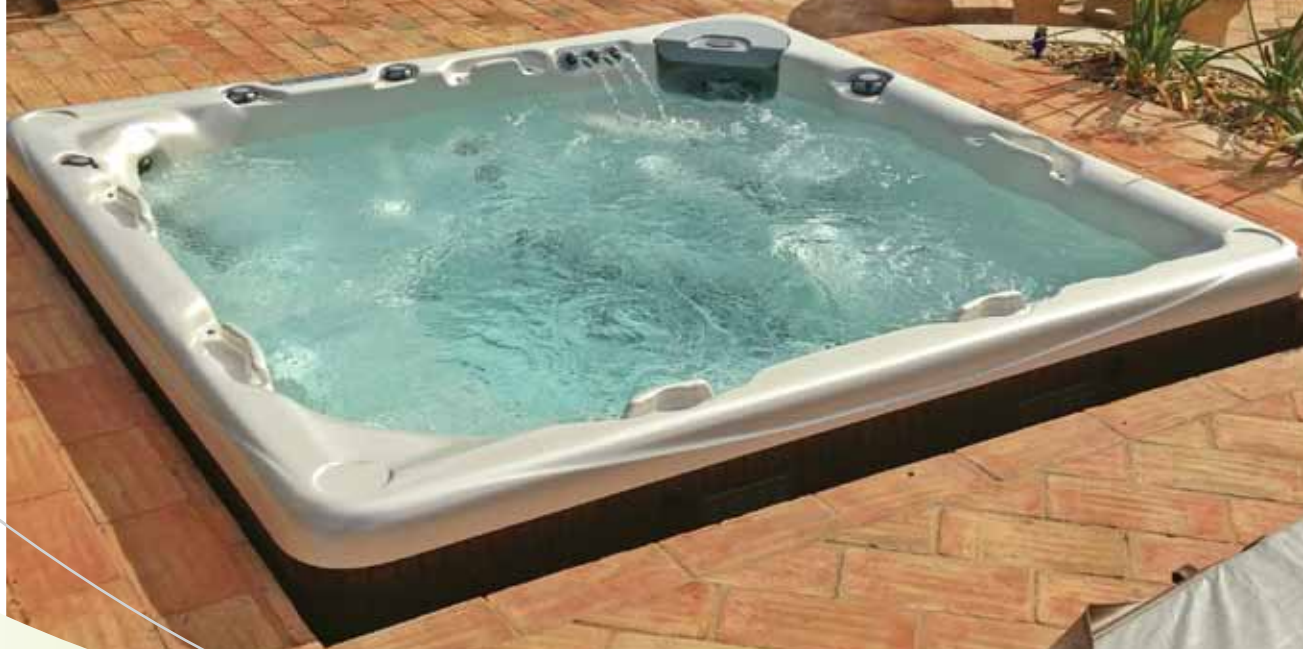
Spa 740 AJL-860-0195