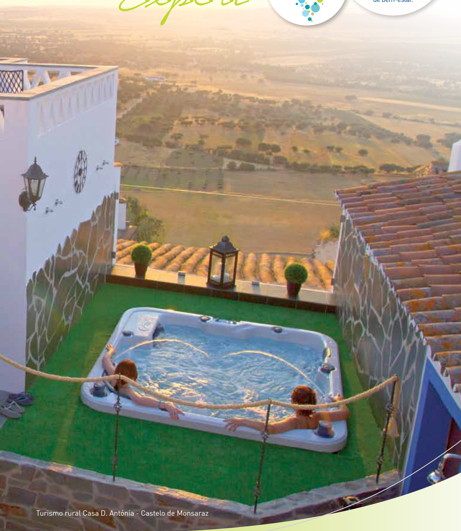
Turismo rural Casa D. Antónia - Castelo de Monsaraz

É mais barato realizar um projecto de Spa que um projecto de piscina. Crescente interesse na área de Wellness e produtos de bem-estar.